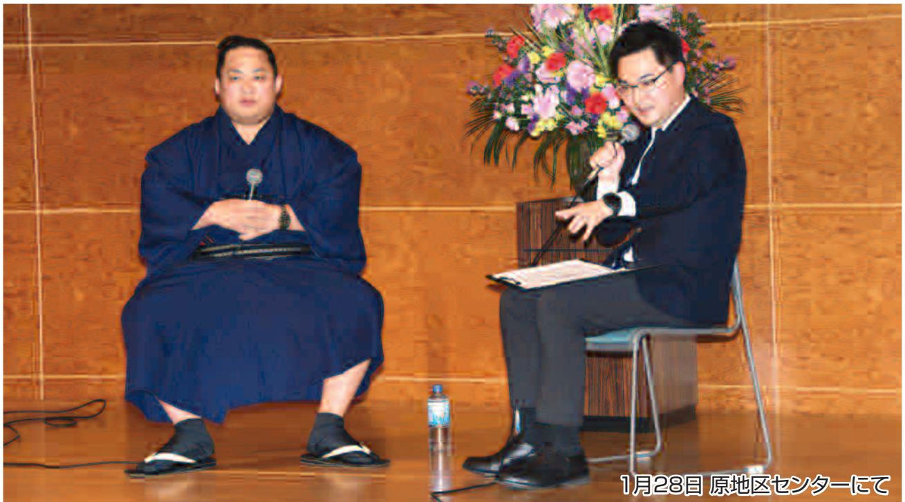
1月28日 原地区センターにて

No. 139 発行者 沼津市商工会 会長 渡邊好孝 〈本所・原支所〉沼津市原1200番地の1 TEL(055)966-1331 FAX (055)967-4925 〈戸田支所〉沼津市戸田1028番地の5 TEL(0558)94-2224 FAX (0558)94-4029 編集 沼津市商工会広報委員会