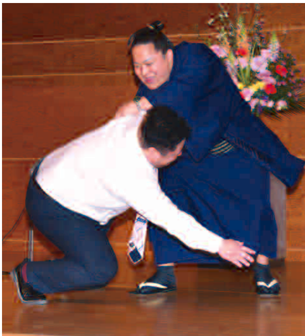
得意技 肩透かし実演

問12・・1月場所を振り返って、ご自身の成績についてどう思われますか。 千秋楽で負けた瞬間、ここに来るのが恥ずかしいなと思いましたが。(笑) 本来なら押し相撲で勝ちたいのですが、その力があまりないので肩透かしに頼っています。