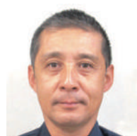
浮 浮島 深澤 英和 ● カネトミ深沢製茶