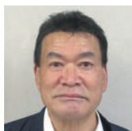
原 原北 松本 三雄 ● 松新