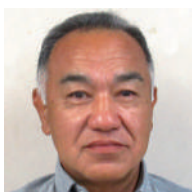
一 一本松、桃里、植田 望月 芳彦 ● (有)望月塗装工業