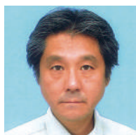
東 東町、西町 木戸 文敏 ● 土地家屋調査士木戸事務所